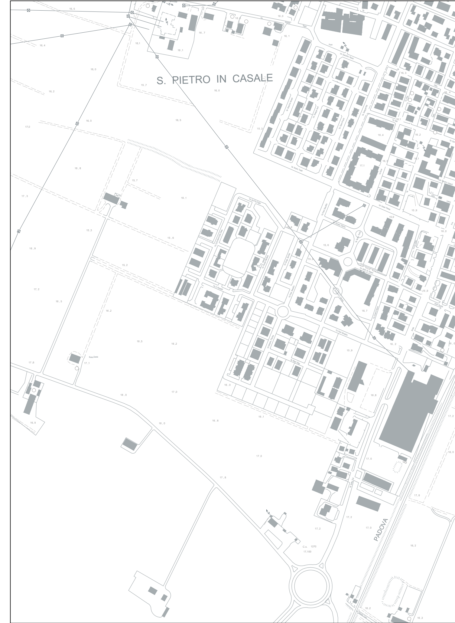
estratto di ctr