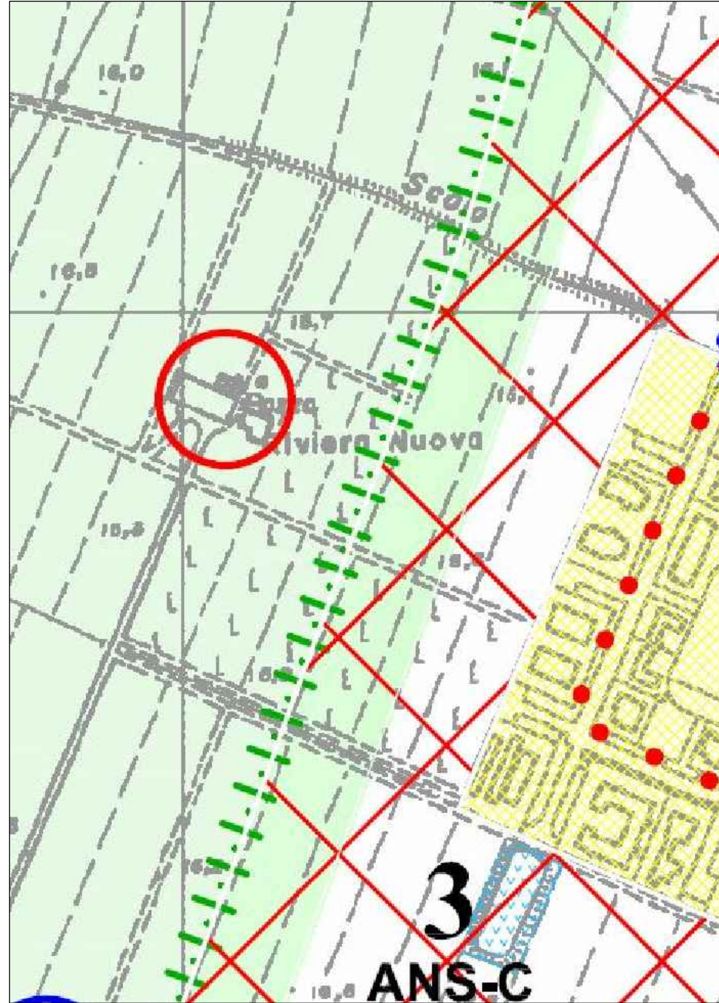
estratto di PSC: tavola 1